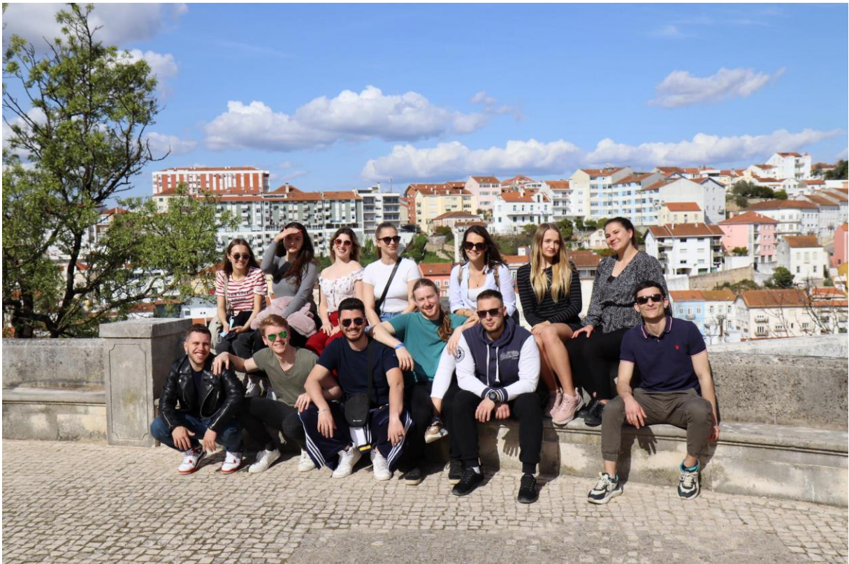
Wspólny wyjazd do Coimbry