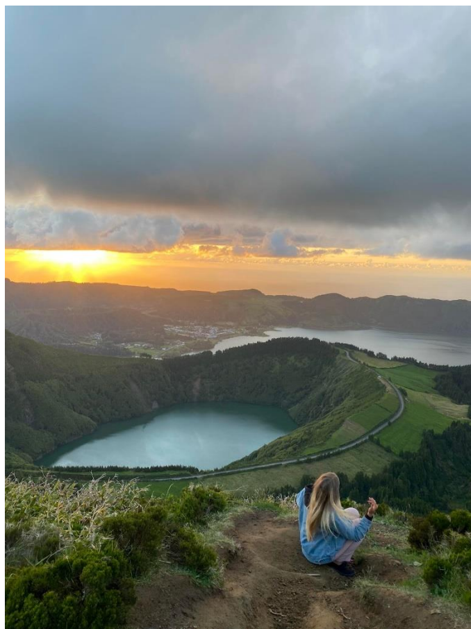
I tu najpiękniejszy zachód słońca, jaki widziałam. Azory <3

A na koniec... Pewnie myślisz, że te wszystkie znajomości są bezwartościowe i nie mają przyszłości. Nic bardziej mylnego! 😊 Widziałam się już z niektórymi 4 razy (!! ) i nawet grupa z 1 semestru była już w Warszawie. Dołączam zdjęcia sprzed dwóch tygodni. Byliśmy również w sierpniu 20 dni razem we Włoszech. Dla chcącego, nic trudnego. 😊